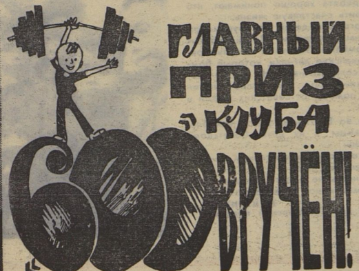
В. АЛЕКСЕЕВ: «Моя самая приятная поездка — к вам, ребята!»

Интересный рассказ Василия Алексева о себе, о соперниках, о спорте слушал переполненный зрительный зал поселкового клуба. А потом было много вопросов.